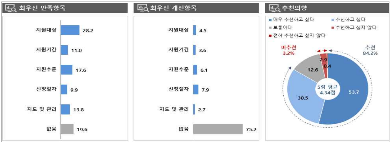
[그림 1] 청년내일채움공제(전체) 만족/개선 항목 및 추천 의향